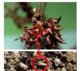
RESSEMIS Les graines survivent plusieurs années dans le sol.

mai-juin → juillet → août septembre → octobre novembre